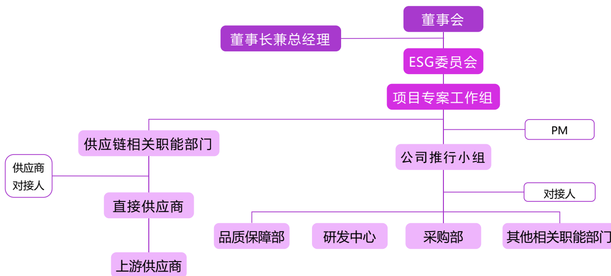
图注：项目组织架构

在董事会的监督指导下，公司ESG委员会牵头成立了冲突矿产尽职调查项目组，协同集团子公司及使用3TG材料供应链上的供应商，共同推进冲突矿产尽职调查且不使用来自冲突地区的矿产。