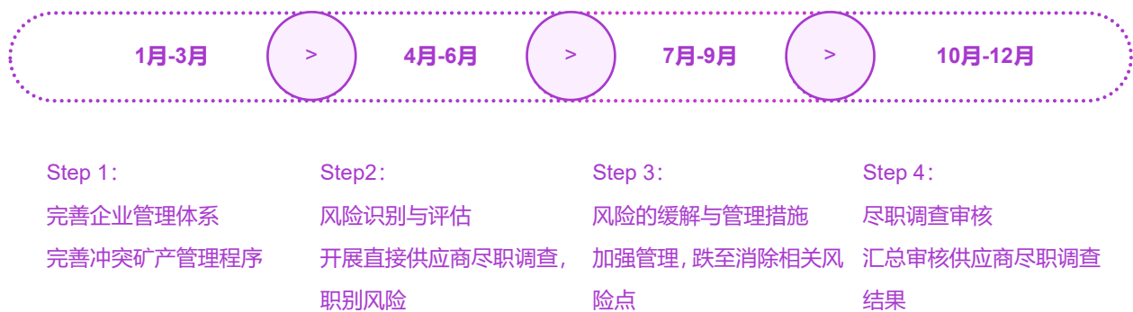
图注：冲突矿产尽职调查项目计划

为符合企业社会责任行为规范准则，防止刚果民主共和国及其周边地区的冲突矿产材料用于我司的产品上，组织举办冲突矿产专题培训，强化内部运营对冲突矿产议题的认识，提升开展负责任材料采购，全面梳理3TG矿物供应链及供应商，明确冲突矿产上游冶炼厂（SOR）所在地开展尽职调查，要求直接供应商冲突矿产调查回复率不低于95%，建立并完善冲突矿产管理程序，提升矿物来源追溯能力，确保100%避免使用冲突矿产，完善供应链风险管控我们参照经济合作与发展组织（OECD）五步流程，并构建了与冲突矿产供应链相关的供应商的尽职调查组织。公司对建立冲突矿产管理体系和进行尽职调查的具体流程并进行了全面规划和有效实施，确保公司产品没有冲突矿产。